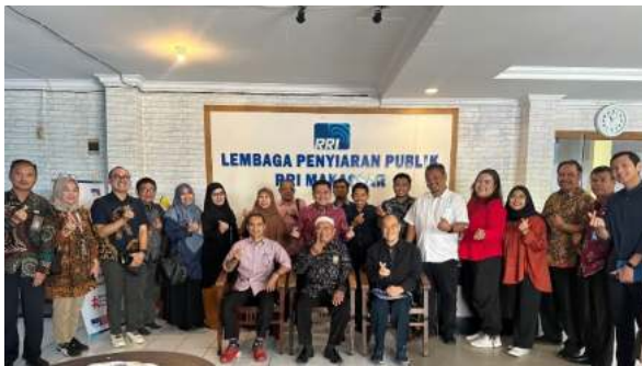
Kunjungan ke RRI Makassar