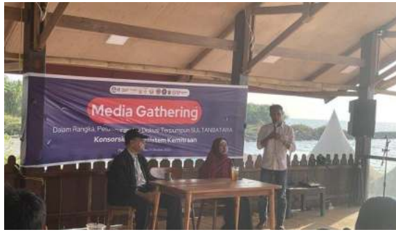
Narasumber 1 kegiatan Media Gathering oleh Ketua PTV Pengampung Konsorsium