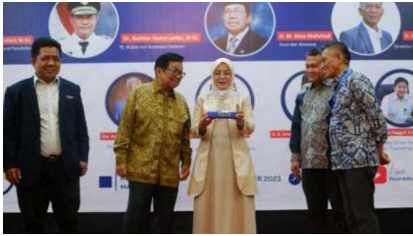
Penyerahan souvenir kepada Ibu Dirjen Vokasi