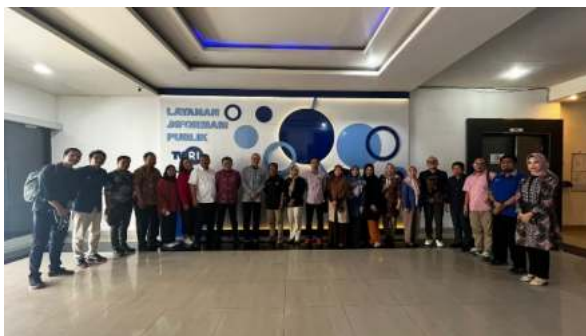
Kunjungan ke TVRI Makassar