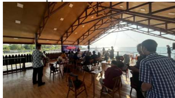
Bersama wartawan dari 15 media