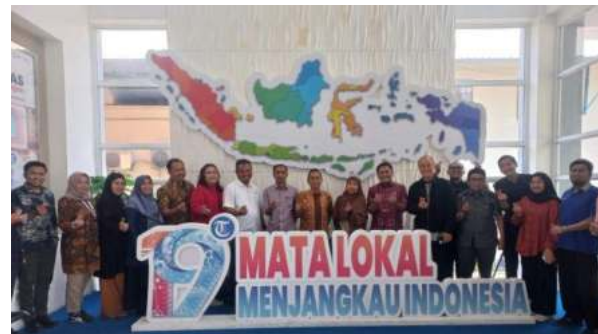
Kunjungan ke Tribun Timur