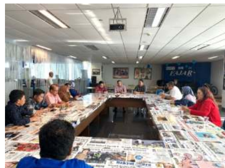
Kunjungan ke Fajar Makassar