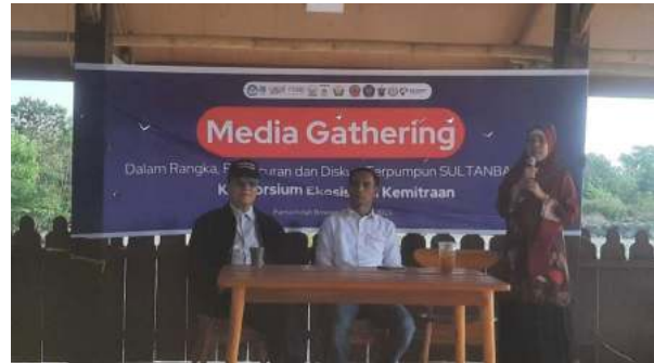
Narasumber 2 kegiatan Media Gathering oleh Ketua Kegiatan Peluncuran dan Diskusi Terpumpun SULTANBATARA