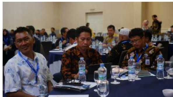
Pimpinan BPPMPV KPTK dan BBPPMPV