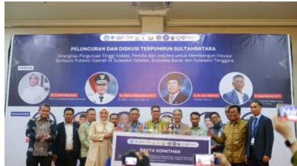
Penandatanganan Pakta Komitmen