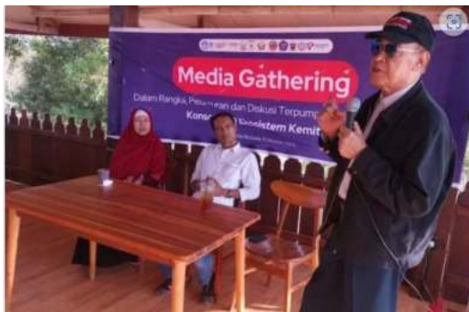
Narasumber 3 kegiatan Media Gathering oleh Tim Pakar