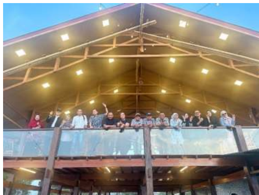
Foto Bersama Panitia, Tim Pakar dan MITRASDUDI di Saoraja Pantai Indah Bosowa