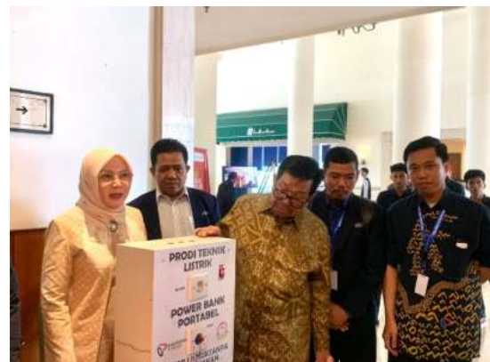
Pameran PTV Politeknik Bosowa