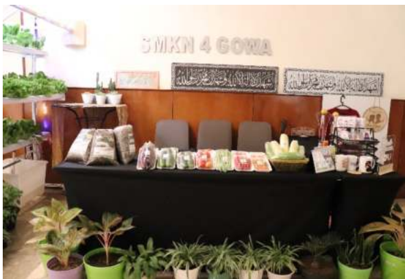
Pameran SMKN 4 Gowa